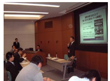
他のMFと協同開催した講演会